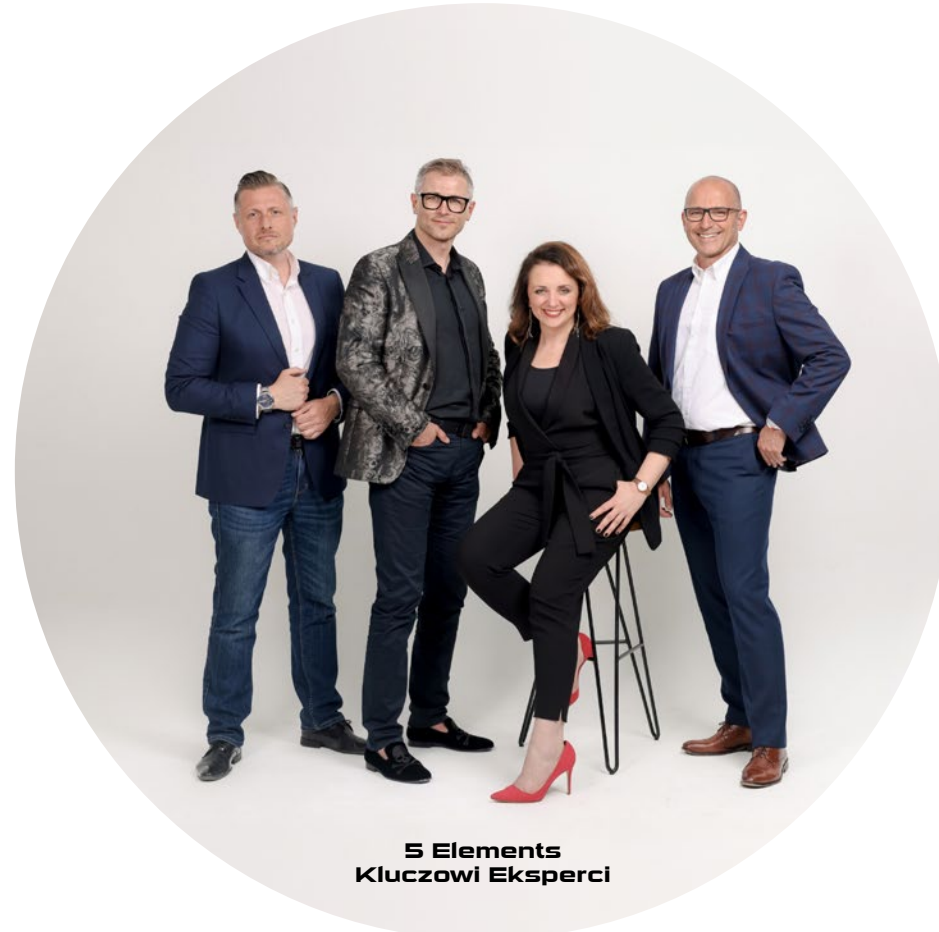
5 Elements Kluczowi Eksperti

Dążymy do zrozumienia i optymalnego wykorzystania potencjału ludzkiego, organizacyjnego i technologicznego w celu osiągnięcia zrównoważonego sukcesu biznesowego.