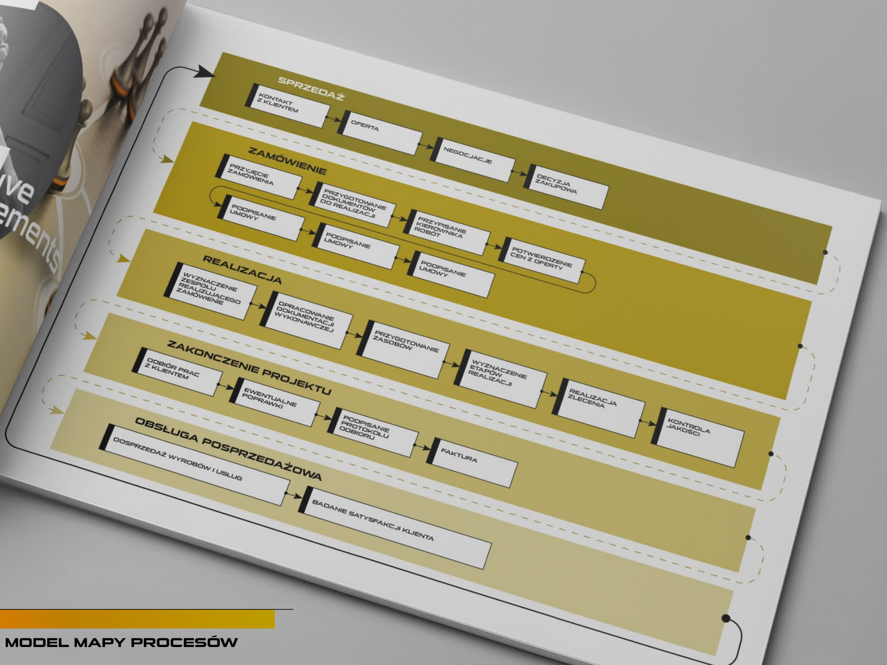
PRZYKŁADOWY MODEL MAPY PROCESÓW