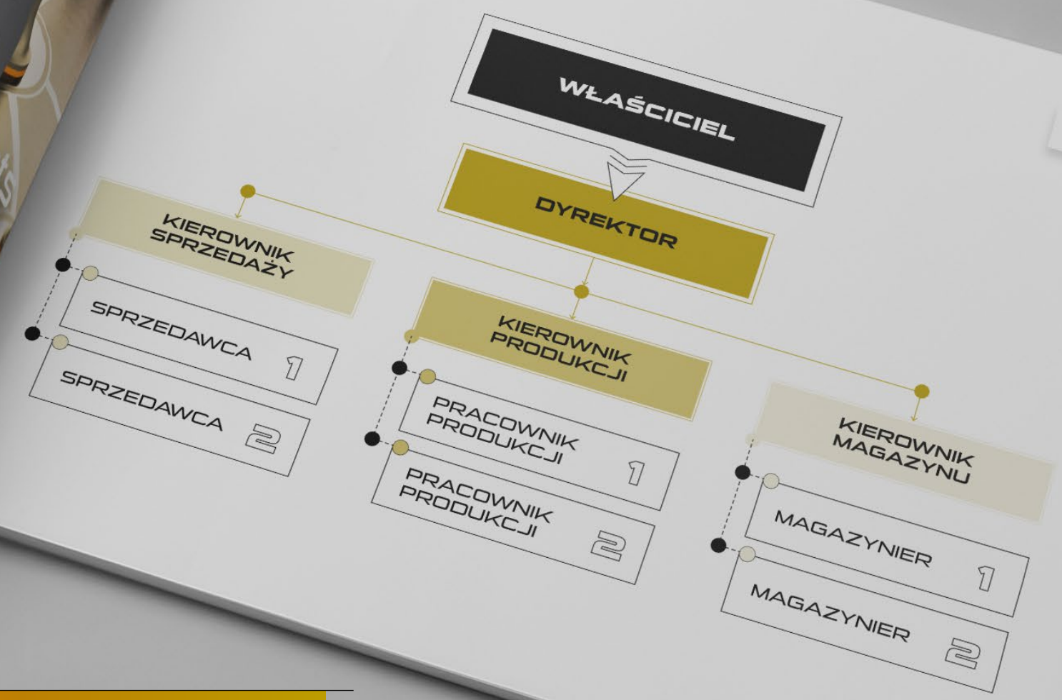
PRZYKŁADOWY MODEL STRUKTURY FIRMY